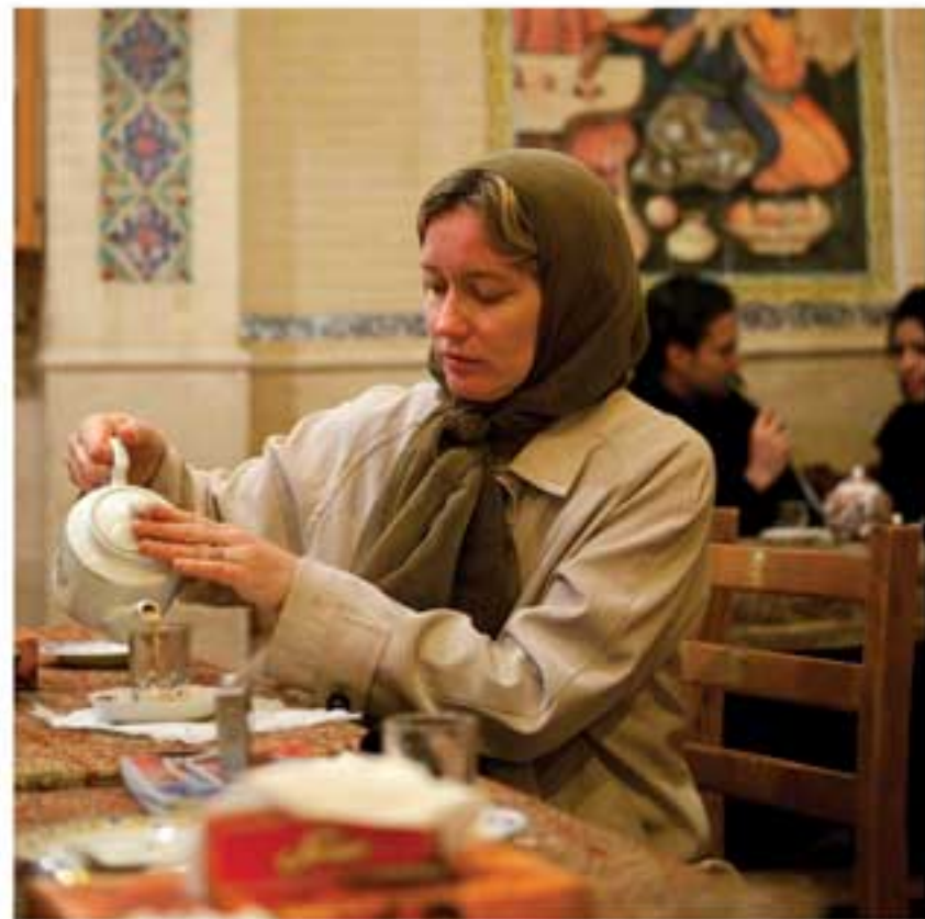
تهران، قهوهخانه سنتی