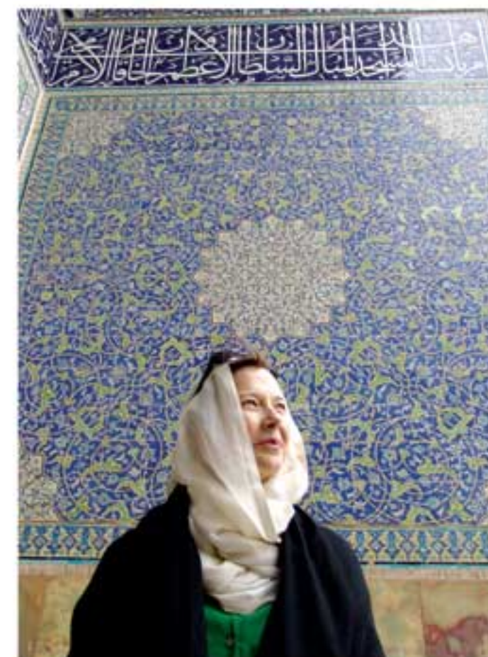
اصفهان، مسجد شیخ لطف‌الله