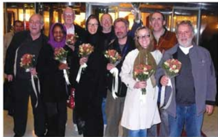
فرودگاه امام خمینی، ورود به تهران