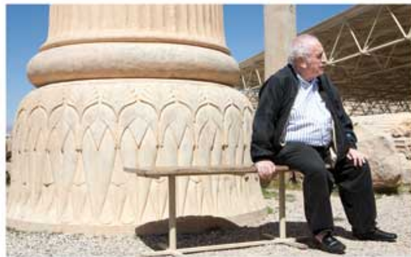
تهران، تخت جمشید