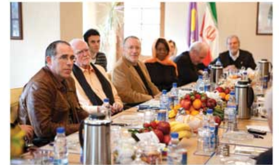
تهران، جلسه با هیات مدیره

سید کنیس، رئیس آکادمی علوم و فنون سینمایی