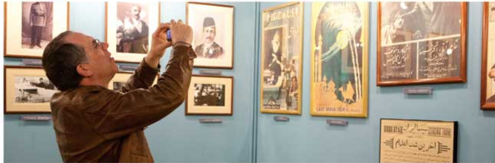
تهران، موزه سینما

ولیم هربرگ، عضو آکادمی علوم و فنون سینمایی